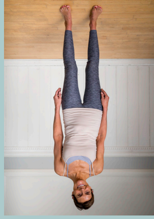
Antal korte knib: