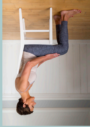
Antal korte knib: