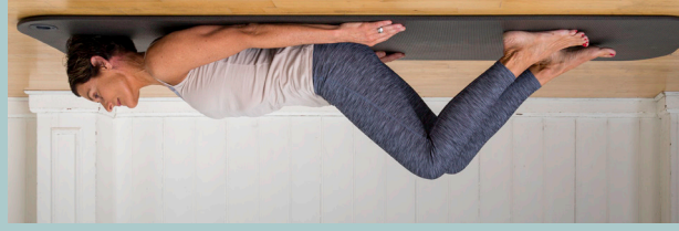
Antal korte knib: